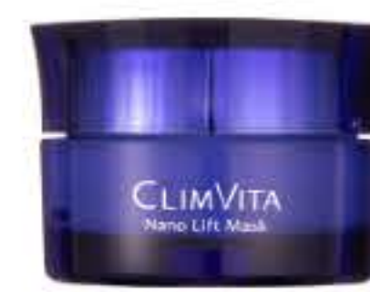
ナノリフトマスク