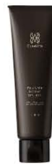
ピュアコラブースターエマルジョン