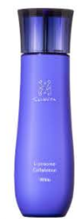
リポソームコラーション