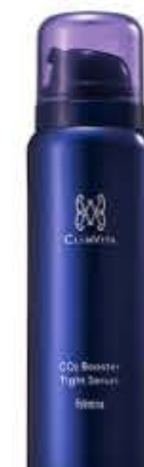
炭酸ブースタータイトセラム