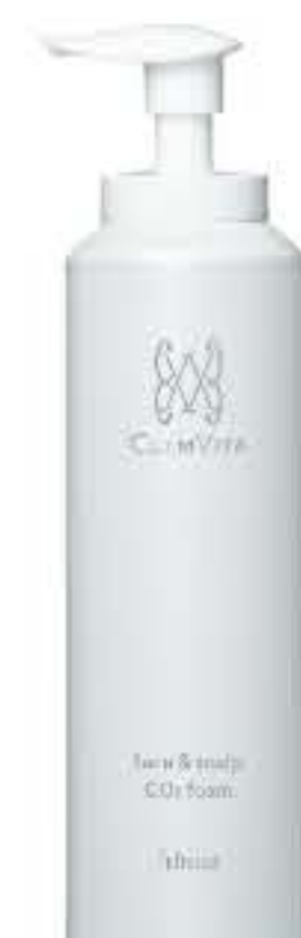
炭酸洗顔フォーム