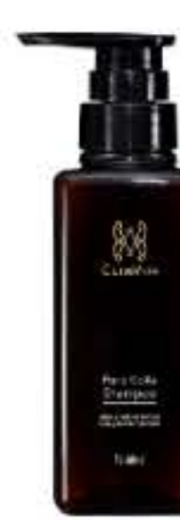
ピュアコラシャンプー