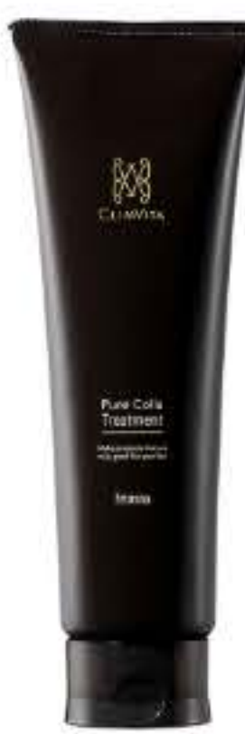
ピュアコラトリートメント