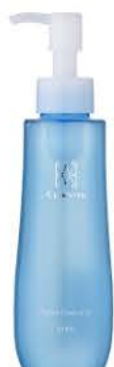
リベアクレンジング