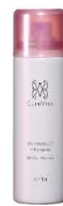
UVプロテクトミルクエマルジョン