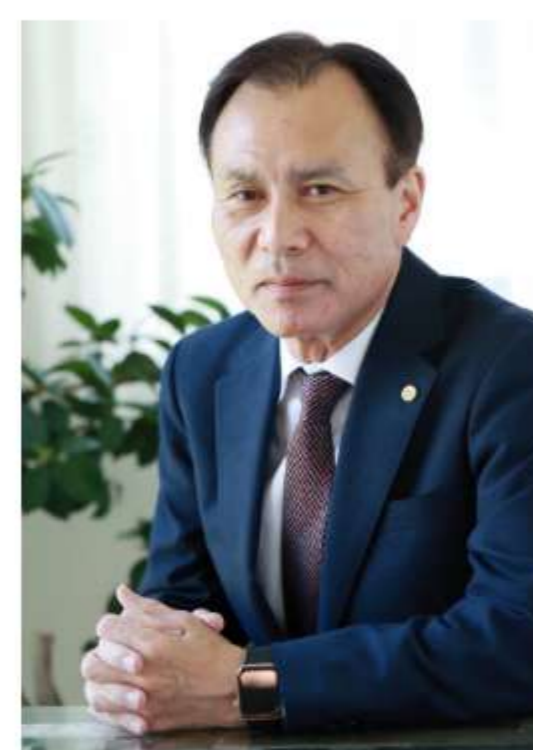
友岡社会保険労務士事務所